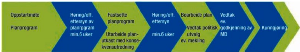
Figur 2 Planprosess for utarbeidelse av reguleringsplaner

Planprosessen skal resultere i et reguleringsplanforslag med konsekvensutredning.