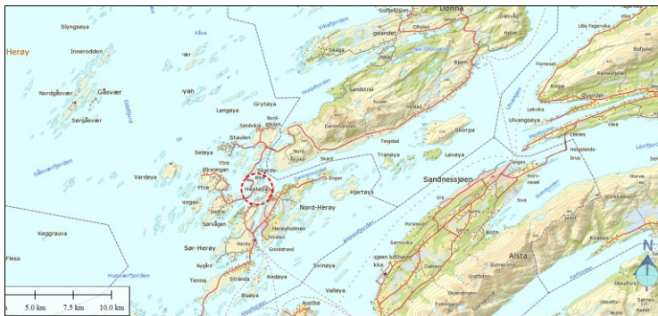
Figur 3 Oversiktlig kart over Herøy - Herøy marine næringspark og utvidelse ligger innenfor stiptet linje i kartutsnittet