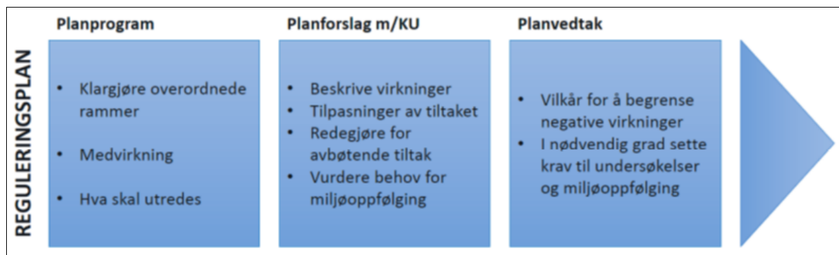
Figur 1 Planprosess for utarbeidelse av reguleringsplan med planprogram

Formålet med planprogrammet er beskrevet i Plan- og bygningsloven §4-1 og i forskrift om konsekvensvurderinger §6. Planprogrammet skal redegjøre for formålet med planen samt avklare hvilke problemstillinger som er viktige i forhold til miljø og samfunn. Det skal gis en beskrivelse av innholdet i planen og omfanget av planarbeidet. Planprogrammet skal avklare nødvendige utredninger for å kunne gi et samlet bilde av tiltakets konsekvenser for miljø og samfunn. Planprogrammet skal også gjøre redegjøre for planprosessen med frister og muligheter for medvirkning.