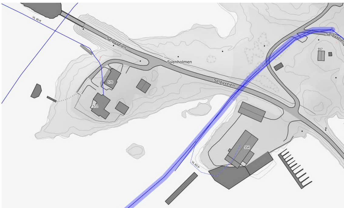
Figur 1 - Bildeutsnitt av vannledning som grenser til planområdet

Kommunen har også en vannledning i umiddelbar nærhet til planområdet. Denne må hensyntas, og vi ber derfor forlagstagerere til å ta kontakt med kommunen sin vann og avløpsetat for å få avklart tidlig i planprosessen hvordan planlagt bebyggelse må hensynta denne vannledningen. Dette må være avklart før planforslag sendes på høring.